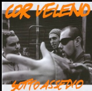
1999 Sotto Assedio