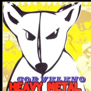
2004 Heavy Metal