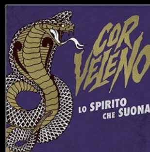
2018 Lo spirito che suona (postumo)