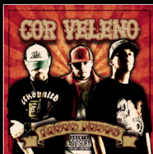
2006 Nuovo Nuovo