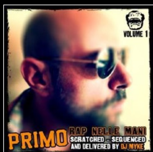
2011 Rap nelle mani vol. I