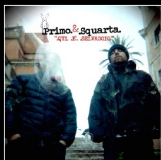
2011 Qui è selvaggio