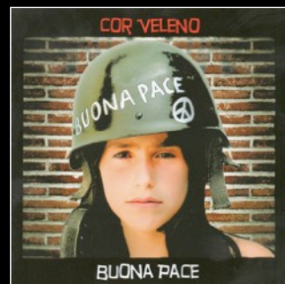
2010 Buona Pace