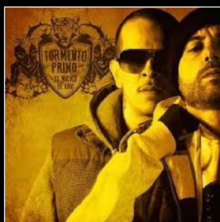
2014 El micro de oro