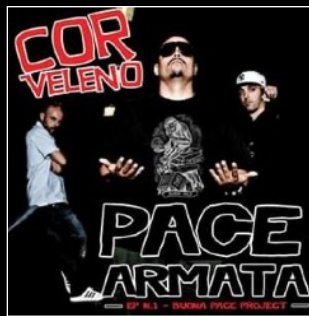
2009 Pace Armata