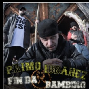
2012 Fin da bambino